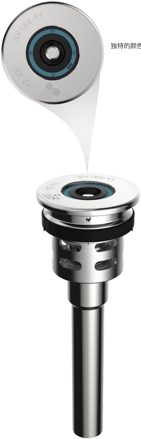
独特的颜色和年份编码有助于定期维护

Micro Matic L型酒矛，带有专门为软饮料产品开发的特制阀门结构。该酒矛为圆形法兰盘和双阀门。 酒矛已经升级为配有创新独特的颜色阀门和年份编码，以便于定期维护。 L型酒矛设计有防篡改环，以监测酒矛未经授权的私自拆卸。