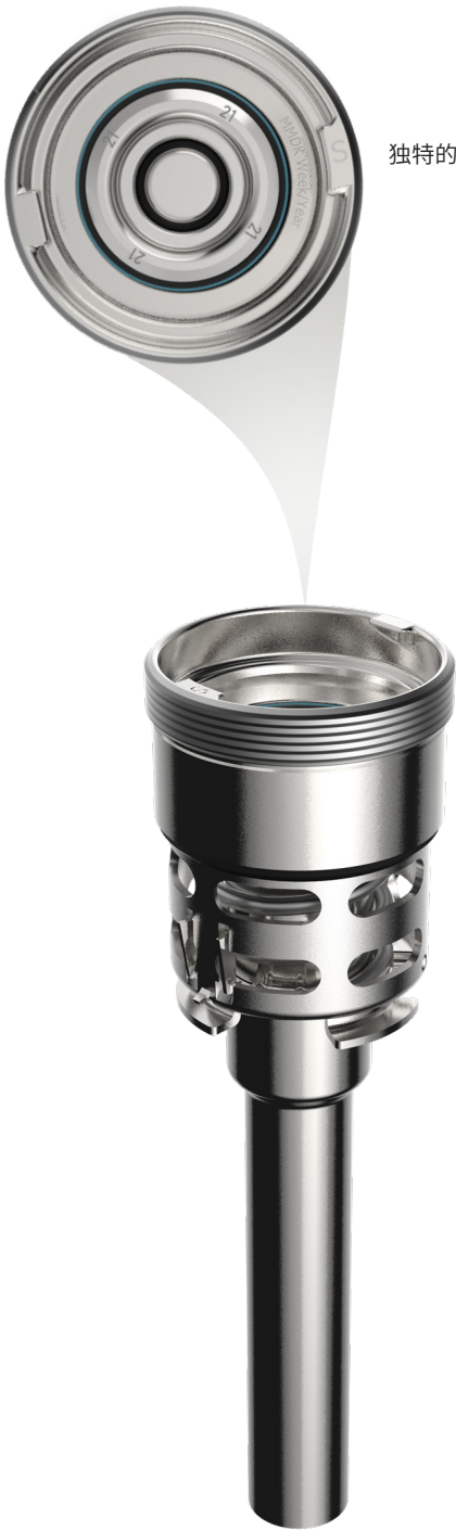
独特的颜色和年份编码有助于定期维护

迈克罗S型酒矛采用安全的双阀门井式设计。酒矛已经升级为配有创新独特的颜色阀门和年份编码，以便于定期维护，同时更易清洁。